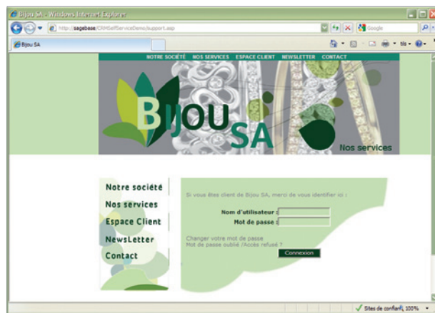
Extranet clients pour suivre et saisir les demandes 24h/24 et 7j/7